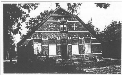
Boerderij Sneul

Toen de gemeente de nieuwe woonwijk op papier inrichtte, kreeg Monumenten-zorg de gelegenheid om een aantal historische panden voor te dragen voor behoud. Niet alle wensen konden worden gehonoreerd, maar boerderij Sneul was daar wel bij. Het betreft een pand aan de Nieuwlandseweg 2, centraal gelegen in Nieuwland. De hoeve staat op een terp, vlak bij de plaats waar de middeleeuwse voorganger Snodele stond. Sneul is een van de weinige authentieke gebouwen in Nieuwland en zou in principe gemeentelijk monument kunnen worden. De oorspronkelijke indeling van het pand, de binnenluiken en de voorgevel met baksteenversiering zijn goed bewaard gebleven.